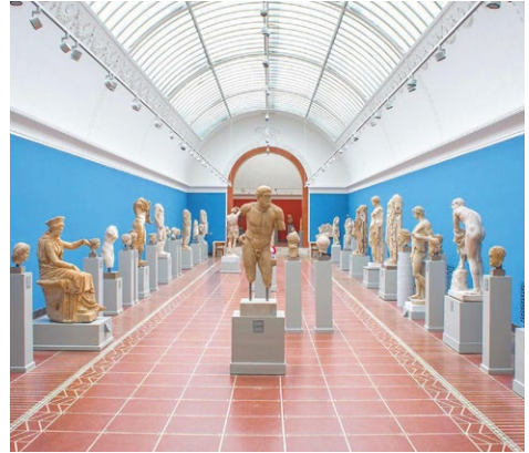
Ny Carlsberg Glyptothek

Zu Fuß gehen wir nach dem Frühstück im Hotel zum Danish Architecture Center , Dänemarks nationalem Zentrum für Architektur, Bauwesen und Stadtentwicklung. Ein fachkundiger Mitarbeiter führt uns dort durch das Gebäude und wirft einen Blick in die laufende Sonderausstellung (ca. 1 Stunde). Mit der Metro fahren wir dann zu einer Führung mit ihm nach Ørestaden , einem Stadtteil mit herausragenden Beispielen moderner skandinavischer Architektur (ca. 2 Stunden).