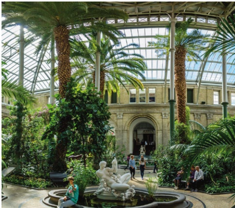
Ny Carlsberg Glyptothek – Palmengarten