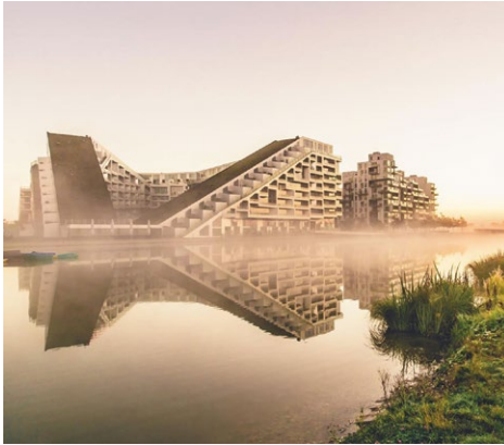
Kopenhagen - Ørestaden

Zu Fuß gehen wir nach dem Frühstück im Hotel zum Danish Architecture Center , Dänemarks nationalem Zentrum für Architektur, Bauwesen und Stadtentwicklung. Ein fachkundiger Mitarbeiter führt uns dort durch das Gebäude und wirft einen Blick in die laufende Sonderausstellung (ca. 1 Stunde). Mit der Metro fahren wir dann zu einer Führung mit ihm nach Ørestaden , einem Stadtteil mit herausragenden Beispielen moderner skandinavischer Architektur (ca. 2 Stunden).