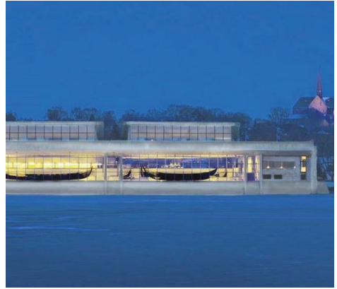
Roskilde – Wikingerschiff Museum

Nach dem Frühstück im Hotel fahren wir mit dem Bus nach Schloss Kronborg (ca. 48 km – eine Stunde). Das Gebäude ist ein bedeutendes Beispiel der nordischen Renaissance, UNESCO Weltkulturerbe und nicht zuletzt Ort der Handlung von Shakespeares Hamlet. Mit einem lokalen Führer sehen wir uns das Schloss und seine Geschichte ausführlich an. Die Führung ist in Englisch.