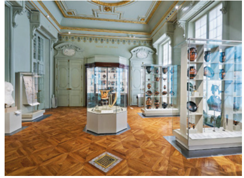
Cabinet des Médailles

Ein Stadtpaziergang führt uns nach dem Frühstück von der Place de la Bastille über die Place des Vosges durch das Marais , das vielleicht schönste Stadtviertel in Paris.