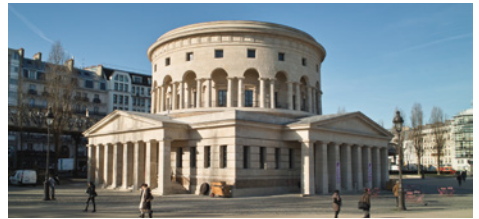
Rotonde de la Villette

Für die Fahrt nach Paris nehmen wir den bequemsten Weg. Frühmorgens um 6:31 Uhr geht es vom Münchner Hauptbahnhof in genau 6 Stunden mit dem Schnellzug TGV zum Gare de l'Est (Bahnfahrt 1. Klasse).